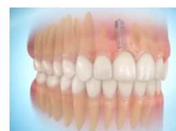
Prothèse dentaire terminée